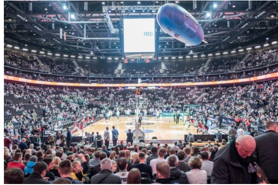
Abbildung 5 Die Basketballarena kurz vor Spielbeginn

Kaunas erkundet sich am besten während der Graffiti Tour, welche man auf eigene Faust anhand eines Flyers (in Welcome Bag enthalten) durchführen kann. Hierbei sieht man, die zahlreichen Parks und die schöne Altstadt (Kaunas Castle). Auch die weitere Umgebung ist sehenswert wie ein Besuch im Freilichtmuseum ca. 25 Busminuten vom Stadtkern entfernt oder eine Besichtigung des großen Staudamms.