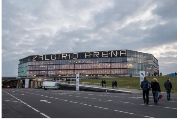
Abbildung 6 Die Basketballarena