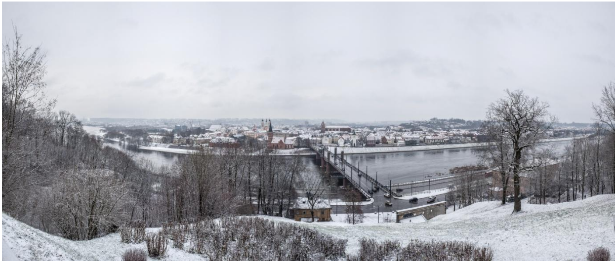
Abbildung 2 Ausblick auf Kaunas von einem der zwei Aussichtspunkte

Kaunas ist die zweitgrößte Stadt in Litauen und hat ca. 350 000 Einwohner, Litauen gehört zur EU und hat den Euro was das bezahlen einfach gestaltet. Kaunas besitzt eine sehr schöne Altstadt, sowie ein international erfolgreiches Basketballteam. Die Amtssprache ist Litauisch, wobei man sich gerade mit der jungen Bevölkerung problemlos auf Englisch unterhalten kann.