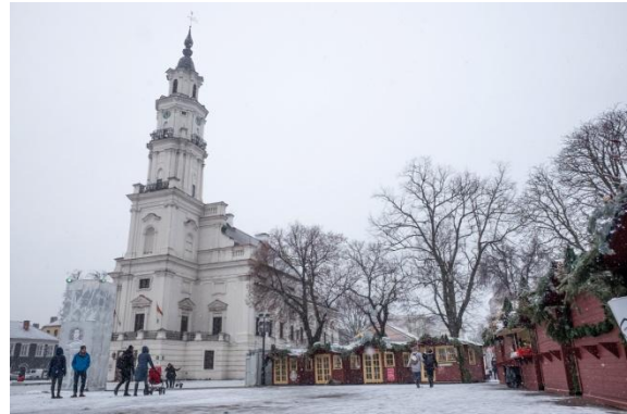
Abbildung 3 Das Rathaus

In den Supermärkten bekommt man so gut wie alles was es in Deutschland auch gibt. Lebensmittelpreise sind zu dem im Vergleich sehr günstig, vor allem regionale Produkte. Im Gegensatz dazu sind Kosmetikartikel zumeist mehr als 4-mal teurer. Gängige Supermärkte sind: Maxima, Iki, Silas, Rimi & Lidl (hier gibt es sogar Spätzle). Auch im Hinblick auf sonstige Geschäfte und Shops gibt es kaum Unterschiede zu Deutschland (H&M, Zara, Euronics, Adidas, Mango, Reverse etc.) zudem gibt es auch mehrere große Shoppingmalls (Akropolis, Molas, Mega). Für das Zahlen mit Bank-/Kreditkarte fielen für mich in Litauen zudem auch keine Kosten an und es war so gut wie überall möglich mit Karte zu zahlen.