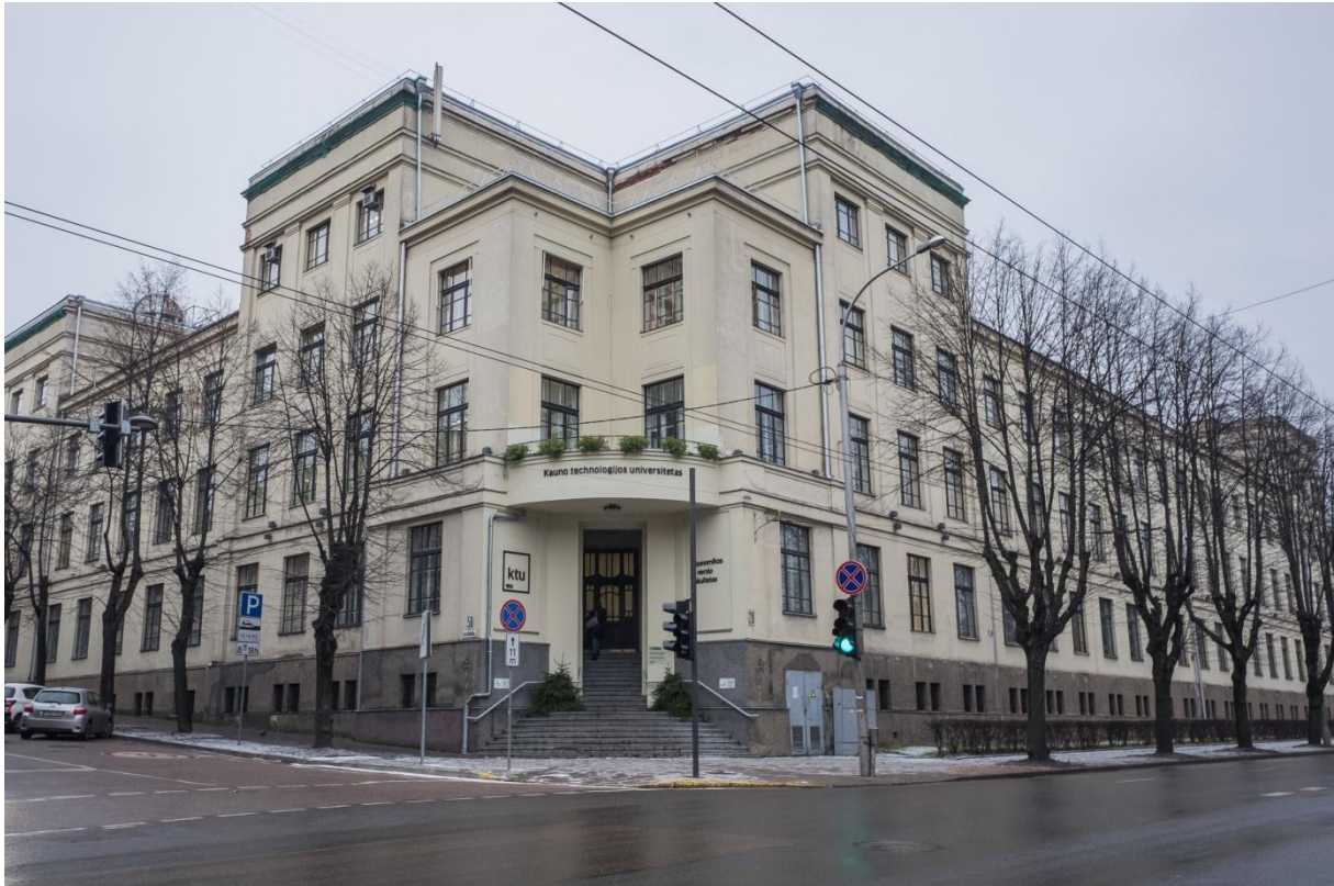
Abbildung 1 "School of economics" in Kaunas in der die meisten Vorlesungen stattfanden

Angekommen in Litauen begann das Semester dort mit der sogenannten „Welcome Week“ in dieser wurde die Universität, sowie die Ansprechpartner vorgestellt. Zusätzlich wurde die Stadt erkundet und es gab einen von der Universität organisierten Eintagesausflug in die Hauptstadt (Vilnius).