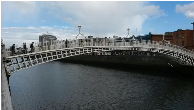
Ha'Penny Bridge in Dublin

Dublin hat verschiedene Busse und die Luas (Stadtbahn) als öffentliche Verkehrsmittel. Ich habe mir damals ein günstiges Fahrrad über www.donedeal.ie gekauft um flexibel unterwegs zu sein. Eine weitere beliebte Methode ist das Dublin Bike für welches man einmalig 20 Euro für ein ganzes Jahr zahlt und an Fahrradstationen ein Fahrrad ausleihen kann. Die erste halbe Stunde ist dabei immer umsonst.