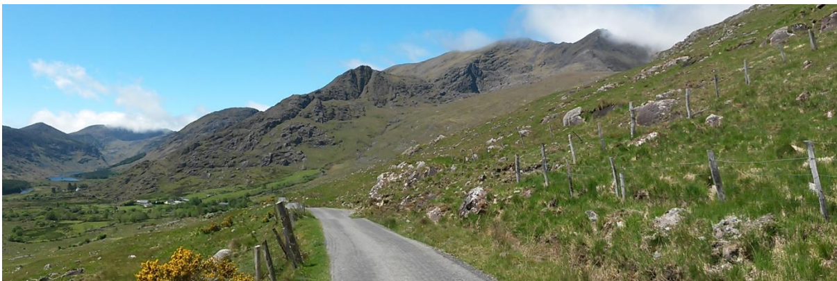
Ring of Kerry Nationalpark