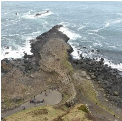
The Giant's Causeway

Belfast ist berühmt für das Titanic Museum und ist eine sehr schöne Stadt in der es sich lohnt einen Tag zu verbringen. Galway und Cork sind recht klein aber ganz nett für ein paar Stunden am Nachmittag und Abend in den Pubs.