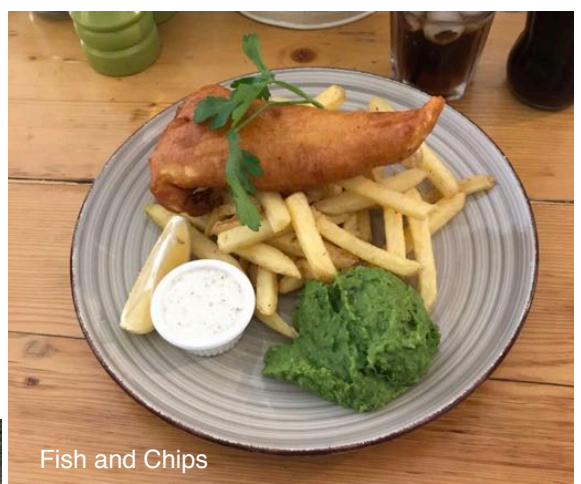
Fish and Chips