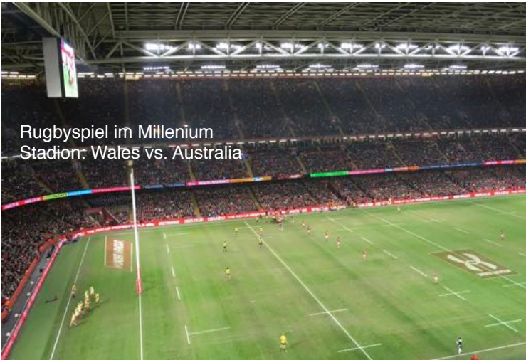
Rugbyspiel im Millenium Stadion: Wales vs. Australia