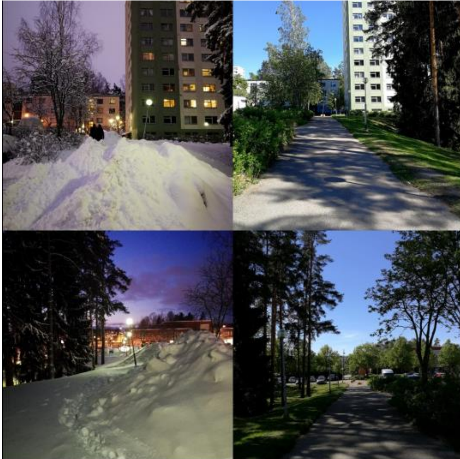
Weg zur Unterkunft (rechtes Hochhaus, kleines Haus hinter dem Baum) im Vergleich Januar – Mai

Insgesamt waren wir zehn Erasmusstudenten, die in dieser Straße untergebracht waren, sodass wir immer viel zu tun hatten.