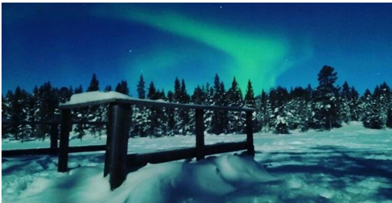
Northern Lights in Lappland (mit dem Handy aufgenommen);

Im Generellen ist Helsinki ein guter Ausgangspunkt für viele Reisen ins Baltikum oder in andere skandinavische Städte, da die Preise nicht allzu hoch sind. Eine Fahrt nach Tallinn kostet circa 10 – 30 € (Hin und Zurück). Der Flug nach Stockholm war mit 68 € sehr günstig. Auch ein Roadtrip durch die Baltischen Staaten kann mit unter 200 € (Fähre nach Tallinn, Mietwagen, Unterkünfte) eingeplant werden.