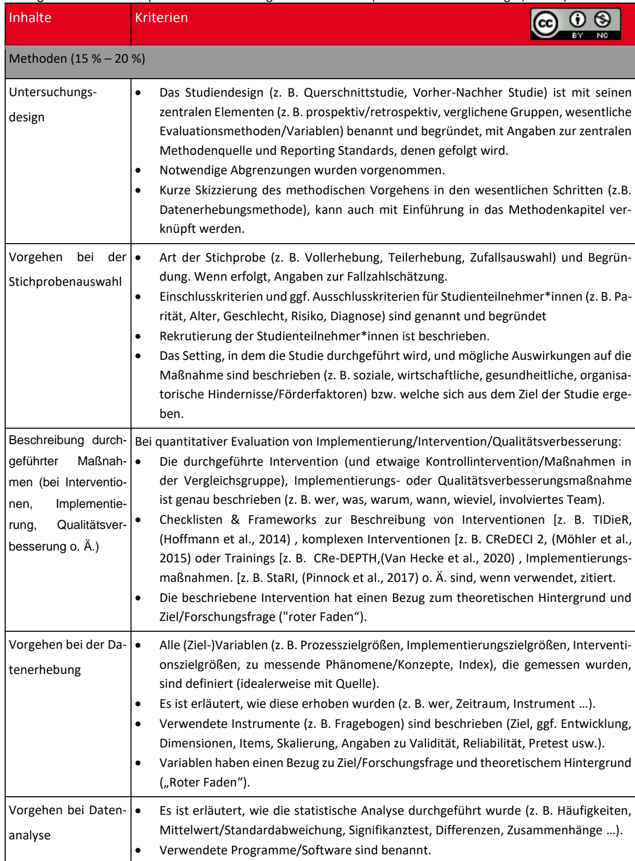
Tabelle 2: Reporting Checkliste zur Sicherung von Transparenz und Nachvollziehbarkeit von studentischen Forschungsarbeiten: Thema quantitative Forschungsarbeiten – Teil 2 (M. Burckhardt & Y. Seeger, 2023b)