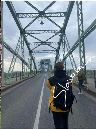
Szechenyi Chain Bridge