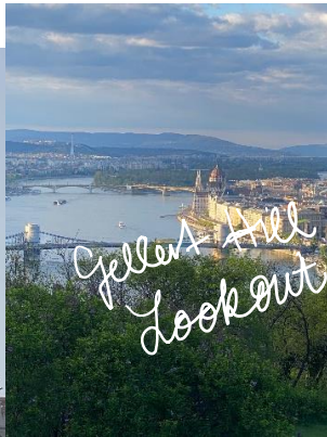
Gellert Hill Lookout